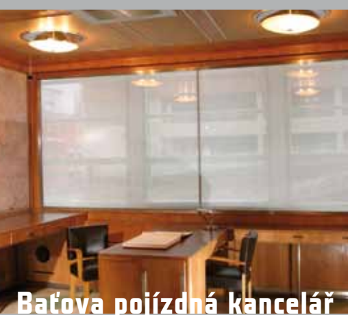
Baťova pojezdna kancelář