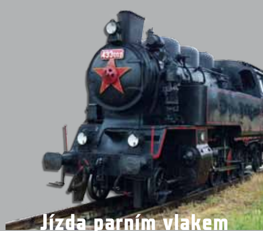
Jízda parním vlakem