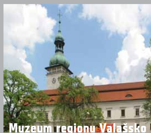
Muzeum regionu Valašsko