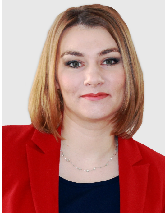
Vážené členky, vážení členové,

dovoluji mi, abych Vás srdečně pozdravila a představila Vám vůbec první číslo Zpravodaje sociálního bydlení Ministerstva práce a sociálních věcí.